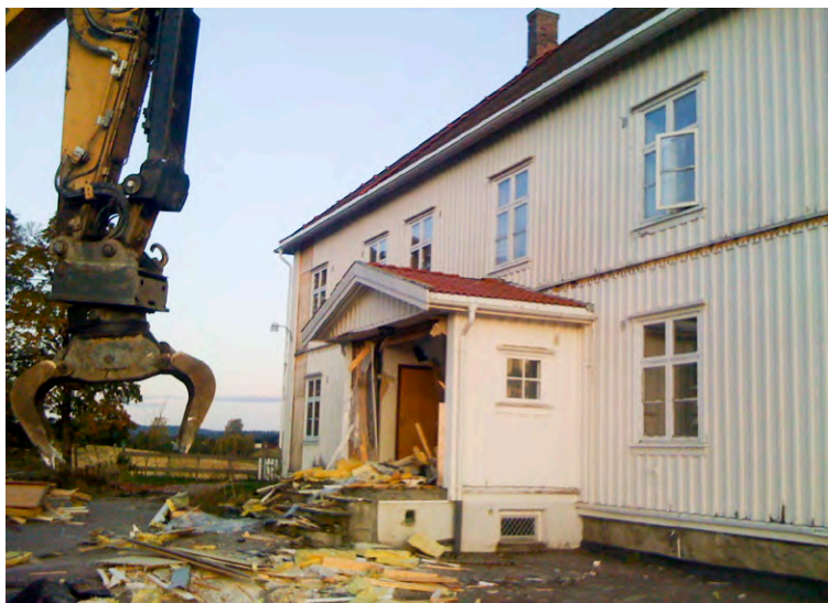
I grålysningen mandag 5. oktober. Grabben har rukket å gjøre stor skade på inngangspartiet. Men resten av bygningen er urørt og fortsatt mulig å redde.

er for sent? Og prosjektlederen? Kunne vi stole på at hun tok den kontrollen på rivingen som saksbehandleren hadde fått inntrykk av? Da mandagen opprant, var det med bankende hjerte fagkonsulentent kjørte fra Oslo til Sørums, i håp om å møte synet av rivingsarbeidere som ryddet på tomten eller i verste fall jobbet med demontering av takkonstruksjonen, men innstilt på å improvisere hvis det var verre ting i gang. Det var verre ting i gang. Der var gravemaskinen i full sving med å knuse inngangspartiet, et lite utbygg, trolig fra 1900-årenes siste halvdel. Klokken var 07.15. Trolig hadde føreren startet kl. 7, og her hadde mye skjedd allerede. Det var bare å presse seg gjennom byggeplassgjerdet, gå en sving frem foran gravemaskinen og vinke til føreren. Han stoppet, og fikk spørsmål om han ikke hadde fått ny beskjed i helgen. Nei, eneste beskjed han hadde fått var å få dette huset ned så fort som mulig. Men skulle de ikke demontere taket først? Nei, med det utstyret de hadde til rådighet (gravemaskinen) var eneste mulige metode å knuse bygningen nedenfra. Fagkonsulentent kunne fortelle om telefoner og samtaler som hadde foregått, og gravemaskinføreren begynte å ta noen telefoner. Fagkonsulentent satte seg da på trappen, for sikkerhets skyld, og begynte selv å ta noen telefoner. Etter