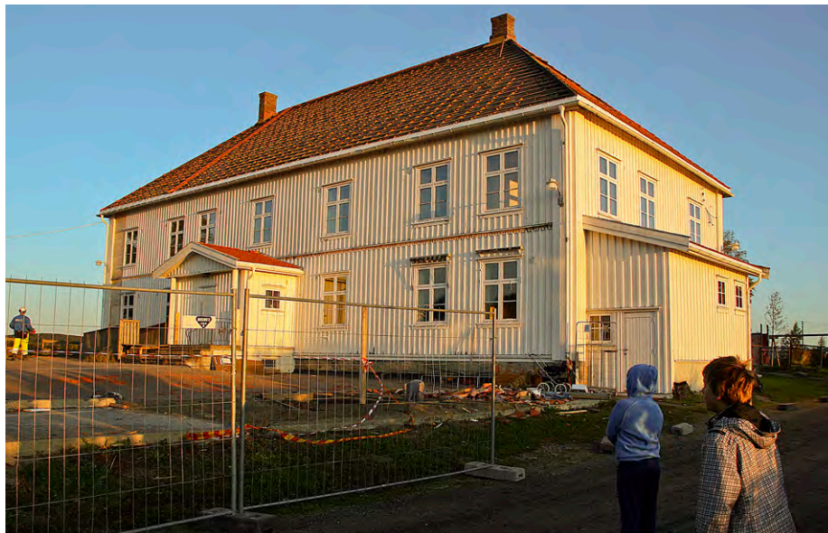
September 2009. Taksteinene er tatt ned og panelet er fjernet der ingeniørfirmaet har gjort undersøkelser. Anleggsgjerdet er på plass. Man forbereder riving.

Innsigelse er et juridisk virkemiddel et statlig særorgan kan bruke for å protestere mot et kommunalt reguleringsforslag i forkant av et kommunalt vedtak. Innsigelsen skal være begrunnet; vanligvis ved at et statlig overordnet hensyn ikke er tilstrekkelig ivare tatt i kommunens reguleringsforslag. Dersom kommunen ikke tar innsigelsen til følge, går saken til mekling hos Fylkesmannen. Dersom mekling mellom statlig særorgan og kommunen ikke fører frem, avgjøres dette stridspunktet ved et reguleringssspørsmål av Miljøverndepartementet.