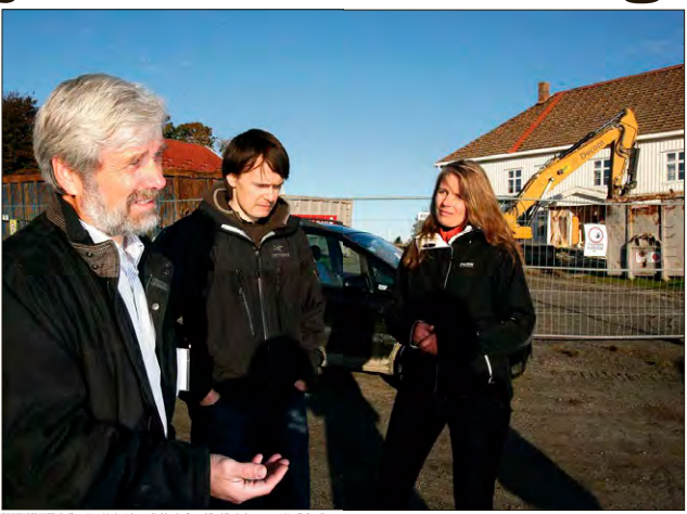
Larve og bygging Magery i Fortidsminneforeningen Oslo. Alerhusa hjelper politikere i Sørøstlandet for full bevaring.

Andersens er tilgjengelig for rådgivning og hjelp til utarbeidelse av planer for bygging av nye hus. Andersens er tilgjengelig for rådgivning og hjelp til utarbeidelse av planer for bygging av nye hus. Andersens er tilgjengelig for rådgivning og hjelp til utarbeidelse av planer for bygging av nye hus.