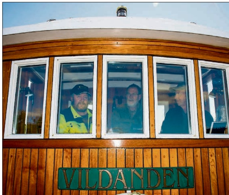
MANNSKAP: Vildanden på seilas på Glomma med riksantikvaren, ordfører og andre gjester.